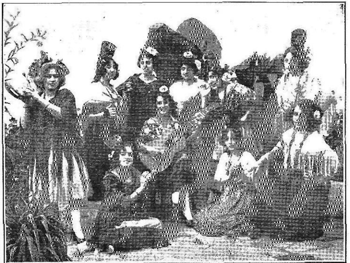
Estepona (Málaga): Otro de los cuadros representados en la fiesta patriótica.