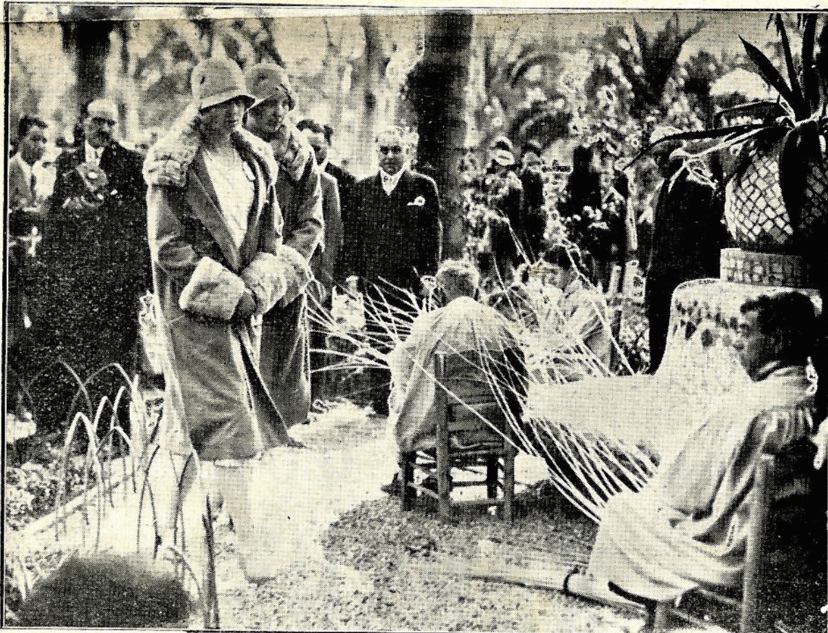
SS. AA. Doña Cristina y Doña Beatriz viendo trabajar a los ciegos